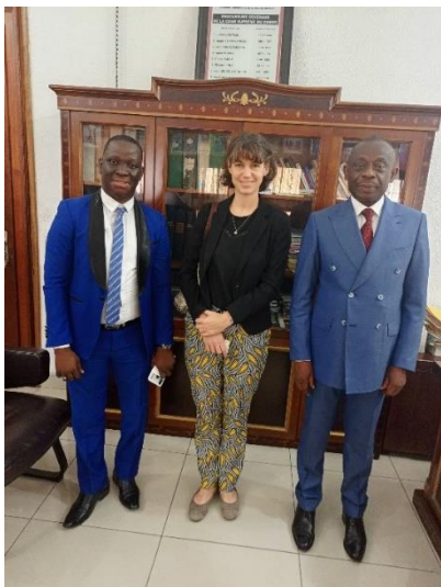
Rencontre avec le Procureur Général près la cour Suprême