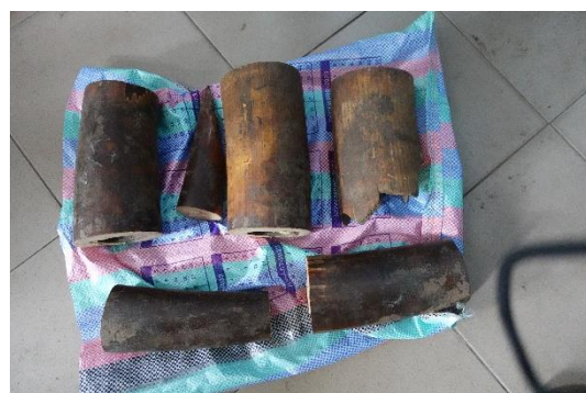
Les 06 morceaux d'ivoire saisis