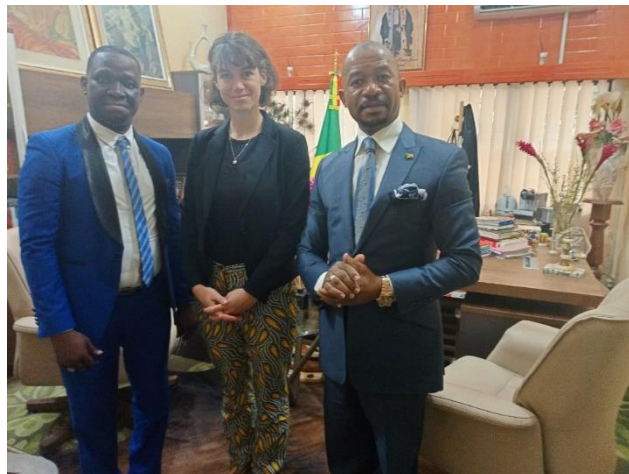
Rencontre du Coordinateur et la coordonnatrice Régionale avec l'Avocat Général