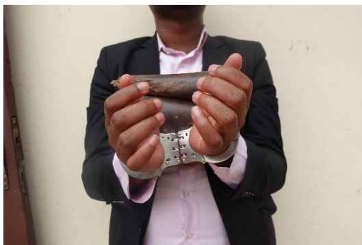
Personne interpellée avec l'ivoire

Le travail abattu par l'équipe ce mois-ci a abouti à une opération réalisée le 10 octobre 2023 à Brazzaville. Un (01) présumé trafiquant a été interpellé au moment où il était sur le point de vendre 01 défense d'éléphant sectionnée en six morceaux. Selon les informations, le présumé trafiquant était en lien avec le trafiquant Ndoli interpellé le 16 Septembre et condamné le 19 Octobre 2023 à une peine d'emprisonnement de deux (02) ans fermes à Owando pour les mêmes faits. Il a été conduit au poste de la gendarmerie pour la suite de la procédure.