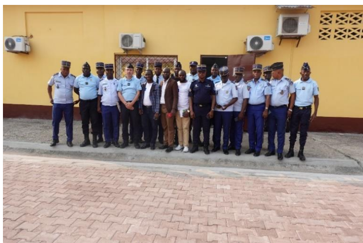
Photos prises lors et à la fin de la formation des 17 officiers supérieurs de la gendarmerie Nationale en stage