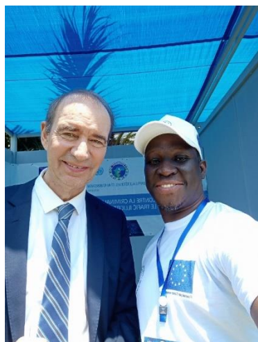
Rencontre avec l'Ambassadeur de l'Allemagne lors du forum de partenariat UE-Congo du 03 au 04 Octobre 2023