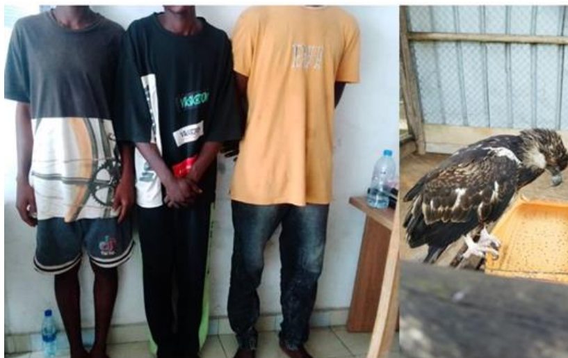
Les trois individus interpellés et l'aigle pêcheur africain saisi

Ils étaient trois à être appréhendés par la gendarmerie peu de temps après une réunion de coordination entre le PALF et la gendarmerie pour une opération en vue, en tentant de vendre un aigle juvénile qu'ils ont capturé malgré l'avertissement reçu sur le caractère non commercial de cette espèce bénéficiant d'une protection intégrale. Après l'interpellation, ils ont été conduits à la gendarmerie pour la suite de la procédure.