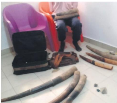
Le délinquant interpellé avec ses ivoires.

L'article 27 de la loi congolaise sur la faune et les aires protégées stipule que « L'importation ; l'exportation ; la détention et le transit sur le territoire national des espèces intégralement protégées ; ainsi que de leurs trophées sont