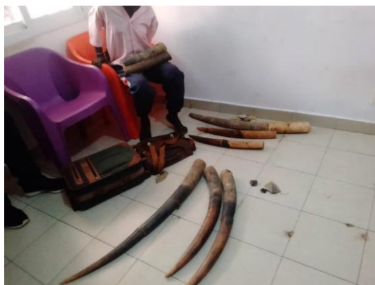
Le présumé trafiquant avec les ivoires saisi

Il est aussi retrouvé dans la même valisette un marteau qu'il avait gardé sur lui pour peut-être se défendre. le présumé trafiquant aurait quitté le village Zanaga quelques jours avec les ivoires cachés dans des sacs pour tromper la vigilance des forces de l'ordre et pour être dans la ville de Pointe Noire par le biais d'un moyen de transport en commun avant son arrestation. Il est conduit à la gendarmerie pour la suite de la procédure.