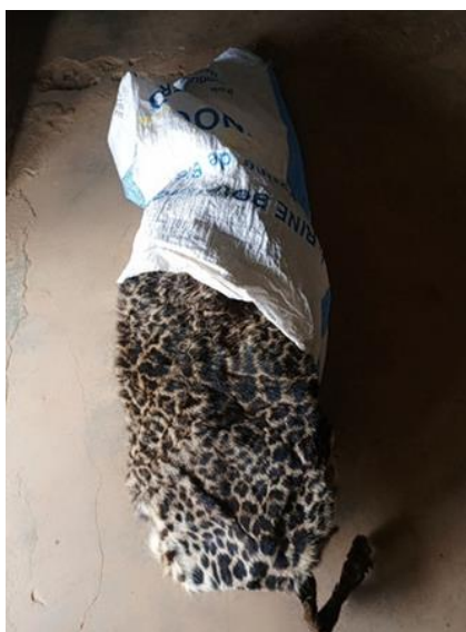
Les deux trafiquants interpellés avec la peau de panthère saisie

Opération 2 : Elle a eu lieu le 30 janvier 2024 dans la ville de Dolisie où trois (03) présumés trafiquants ont été interpellés au moment où ils étaient sur le point de vendre 02 défenses d'éléphant sectionnées en quatre morceaux dans un hôtel. Ces présumés trafiquants auraient quitté le village Makabana avec les ivoires par le biais d'un moyen de transport en commun pour Dolisie.