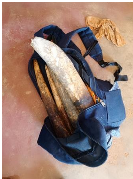
Trois présumés trafiquants arrêtés avec deux pointes d'Ivoire sectionnées en quatre morceaux